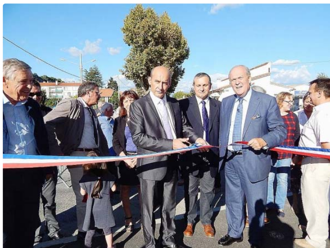
Le coupé de ruban et les interventions qui ont suivi ont témoigné de la transition de ce lieu de vie emblématique.

Écrit par Jean Banner | Lundi 13 octobre 2014 14:00 | Imprimer