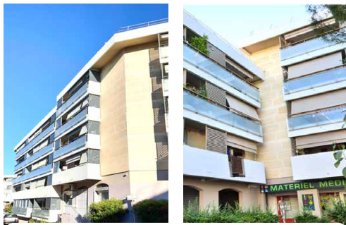
Bâtiments Tranche 1 (Espigaou & Argelas) après réhabilitation

Renforcement des balcons Mise en conformité de sécurité incendie Pose de portes palières sécurisées