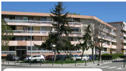
Le Nautilus – Avant et Après Réhabilitation