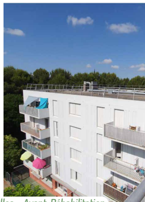
Bâtiments 2ème Tranche (Rigaou, Cigalou & Paquerettes) Photos actuelles - Avant Réhabilitation

A ce stade d'avancement de la rencontre locataire, la priorité que vous avez exprimée est le traitement du confort thermique (conforts d'été et d'hiver).